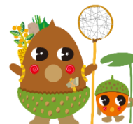
ごしょどん・ごしょたん